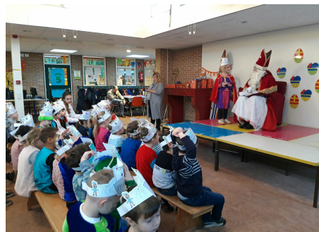
Sint bij groepen 1 en 2